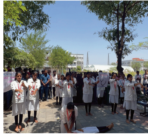
विद्यार्थ्यांशी थेट संवाद साधला. त्या म्हणाल्या की, आजच्या धावपळीच्या युगात आरोग्याकडे दुर्लक्ष करून चालणार नाही. शिस्तबद्ध जीवनशैली आणि आरोग्याप्रती जागरूकता हीच यशाची पहिली पायरी आहे. सुमारे एक तास चाललेल्या या