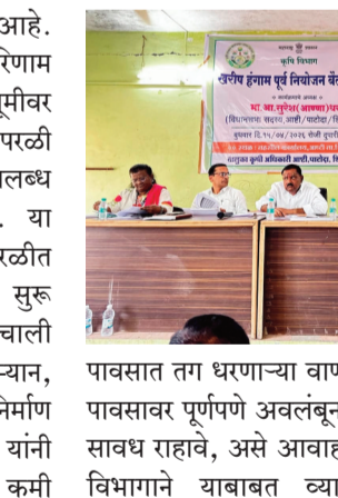
पावसात तग धरणाऱ्या वाणांचा विचार करावा, तसेच पावसावर पूर्णपणे अवलंबून असलेल्या बियाण्यांपासून सावध राहावे, असे आवाहनही करण्यात आले. कृषी विभागाने याबाबत व्यापक जनजागृती मोहीम