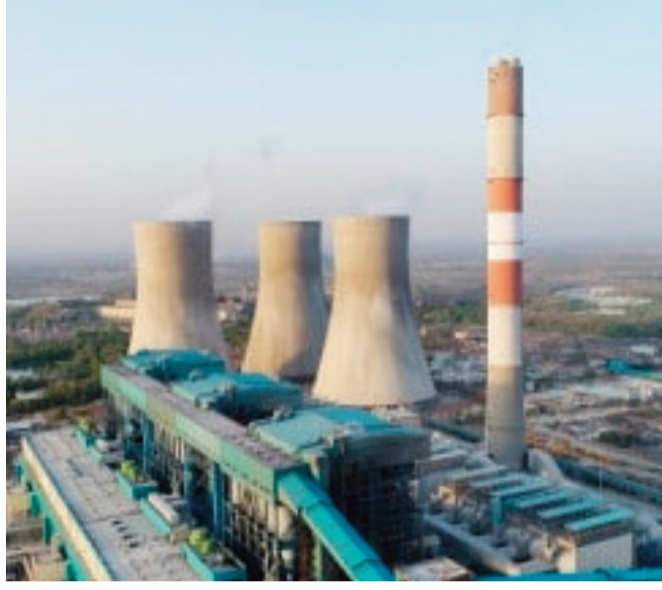
या जाचक अटीवर चर्चा करण्यासाठी कोराडीच्या मुख्य अभियंत्यांची भेट मागितली होती मात्र खापरखेडाचे कंत्राटदार मुख्य अभियंत्यांना भेटायला येणार असल्याची

सुव्यवस्थेचा प्रश्न निर्माण होण्याची शक्यता वर्तवली जात आहे. दोन दिवसांपूर्वी कोराडी औष्णिक वीज केंद्रात २२ कोटी रुपयांच्या कामांच्या निविदा निघाल्या होत्या. यामध्ये खापरखेडा औष्णिक वीज केंद्रात कार्यरत असलेले काही प्रशिक्षित कंत्राटदार केवळ १० लाख रुपयांच्या एका छोट्या कामाची निविदा भरण्यासाठी गेले होते मात्र या निविदा प्रक्रियेत सदर काम फक्त कोराडी येथील स्थानिक कंत्राटदारांनाच मिळेल अशी विशिष्ट आणि जाचक अट टाकण्यात आल्याचे समोर आले. खापरखेडा येथील कंत्राटदारांनी