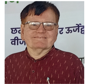
छत्रपती आणि मंगलनाथ मल्लिपल निधी बँकेत हजारो शेतकऱ्यांनी, कष्टकऱ्यांनी, महिलांनी आणि ज्येष्ठ नागरिकांनी आपल्या कष्टाची कमाई, मुलींची लग्ने, मुलांचे शिक्षण आणि वैद्यकीय उपचारांसाठी मुदत ठेवी म्हणून बँकांमध्ये ठेवली होती. मात्र, गेल्या काही काळापासून या बँकांचे व्यवहार ठप्प झाल्यामुळे सर्वसामान्य ठेविदार हवालदिल झाले आहेत. अनेकांच्या घरात गंभीर आर्थिक अडचणी निर्माण झाल्या असून, अनेक कुटुंब उघड्यावर पान २ वर