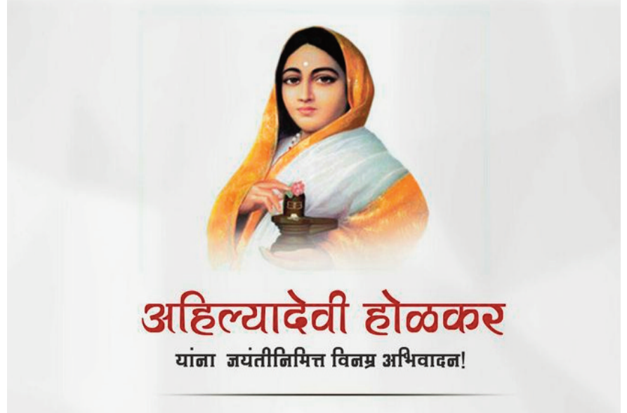
अहिल्यादेवी होळकर यांना जयंतीनिमित्त विनम्र अभिवादन!