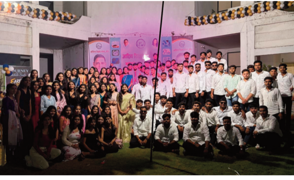
उज्वल भविष्यासाठी गुरुकिल्ली आणि सातत्याची गरज असते. विद्यार्थ्यांनी भविष्यात मोठ्या पदांवर पोहोचून देशाच्या विकासात योगदान द्यावे असे