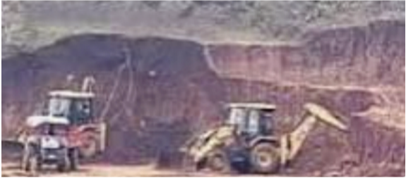
बंद(सिल) केलेल्या खदानी व पाटबंधारे विभागातील हाद्वितील जमीनीतून सन २००२३ पासून ते आज पर्यंत तलवाडा येथील व गेवराईसह तलवाडा परिसरातील जेसीबी मालक, सामाजिक बांधलकी जोपासना- या विवीध पदाधिका-यांच्या माध्यमातून शासन व प्रशासनाच्या निदर्शनास आणून दिलेले आसतांना देखील महसूल व पाटबंधारे पान २ वर

चालक तसेच ट्रॅक्टर मालक चालकांनी मोठ्या प्रमाणात अवैध उत्खनन केल्याची बाब वेळोवेळी विवीध वृत्तपत्राच्या माध्यमातून व पर्यावरण प्रेमी